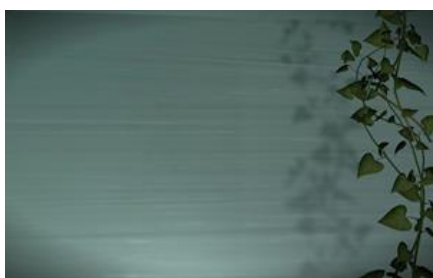
Cagliari. Teatro Massimo, il 20 ottobre debutta "Purpurine"

Gemelle e principesse di nascita, cresciute nell'infanzia reale; un vero paradiso. Ma quando il re Agamennone, il loro padre, deve partire in guerra a Troia, sua moglie la regina Clitemnestra passa il suo tempo con Egisto, un amante. Entrambi sperando di non rivedere mai Agamennone e così ottenere un potere totale sulla città e i suoi abitanti. Ma una tragedia non si può evitare, il destino è il destino. Agamennone torna dalla guerra vincitore ma non aveva il minimo dubbio che sua moglie e il suo nuovo amante avessero previsto di ucciderlo. Così Egisto e Clitemnestra governano senza pietà, due demoni al potere, criminali senza limiti, senza morale. Elektra si ribella e, trattata come una schiava, aspetta di vendicare il padre con l'aiuto del fratello scomparso : Oreste. Dall'altra parte, Chrysothemis vive con la paura della morte, e spera ogni giorno di fuggire e ricominciare a vivere come tutte le donne. Elektra, all'opposto vive con la morte, nella consapevolezza del sacrificio per la vendetta.